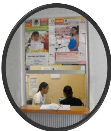
Modulo de Afiliación y Orientación al seguro Popular

Ubicado en el centro de Salud de Ziracuaretiro.