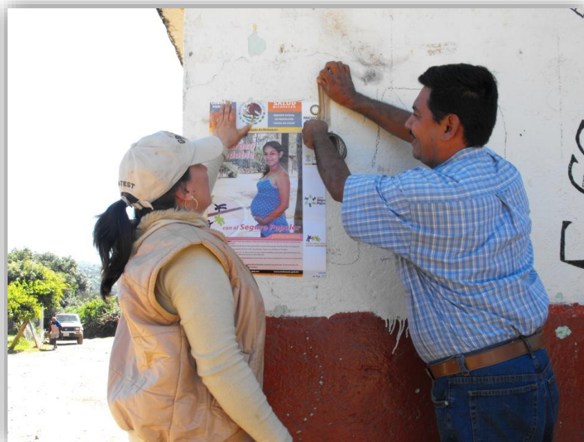
colocación de propaganda en la Localidad de la Ciénega

En cumplimiento de promover la integración y aplicación de programas federales de salud, se difunde “El seguro Popular” a favor de los habitantes y también en zonas alejadas de la municipalidad.