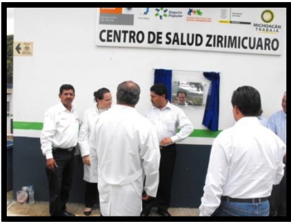
Develación de la placa

SE LLEVO A CABO LA CERTIFICACIÓN DE “COMUNIDAD SALUDABLE” el día 17 de Agosto.